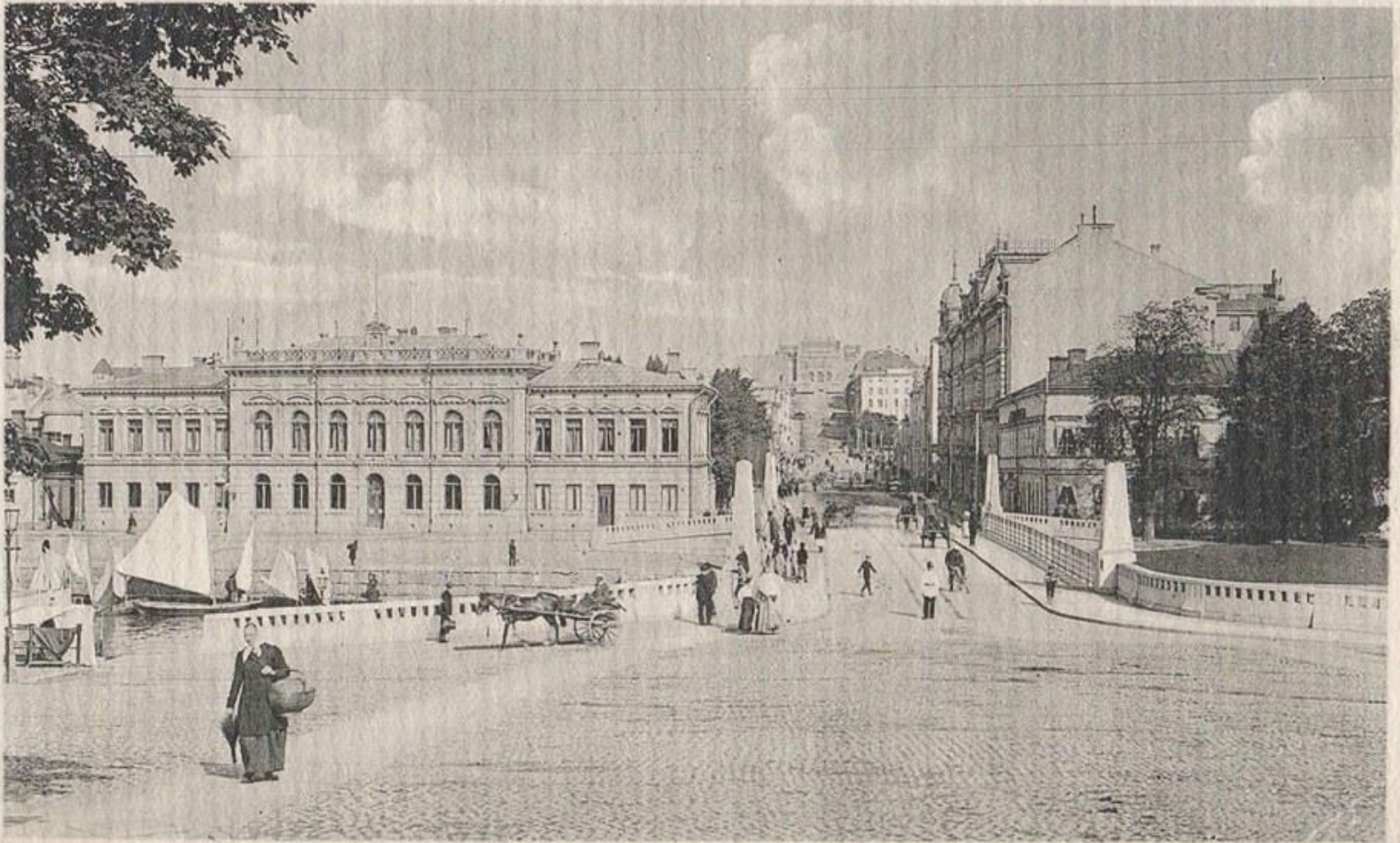
TURKU - Kaupungintalo.