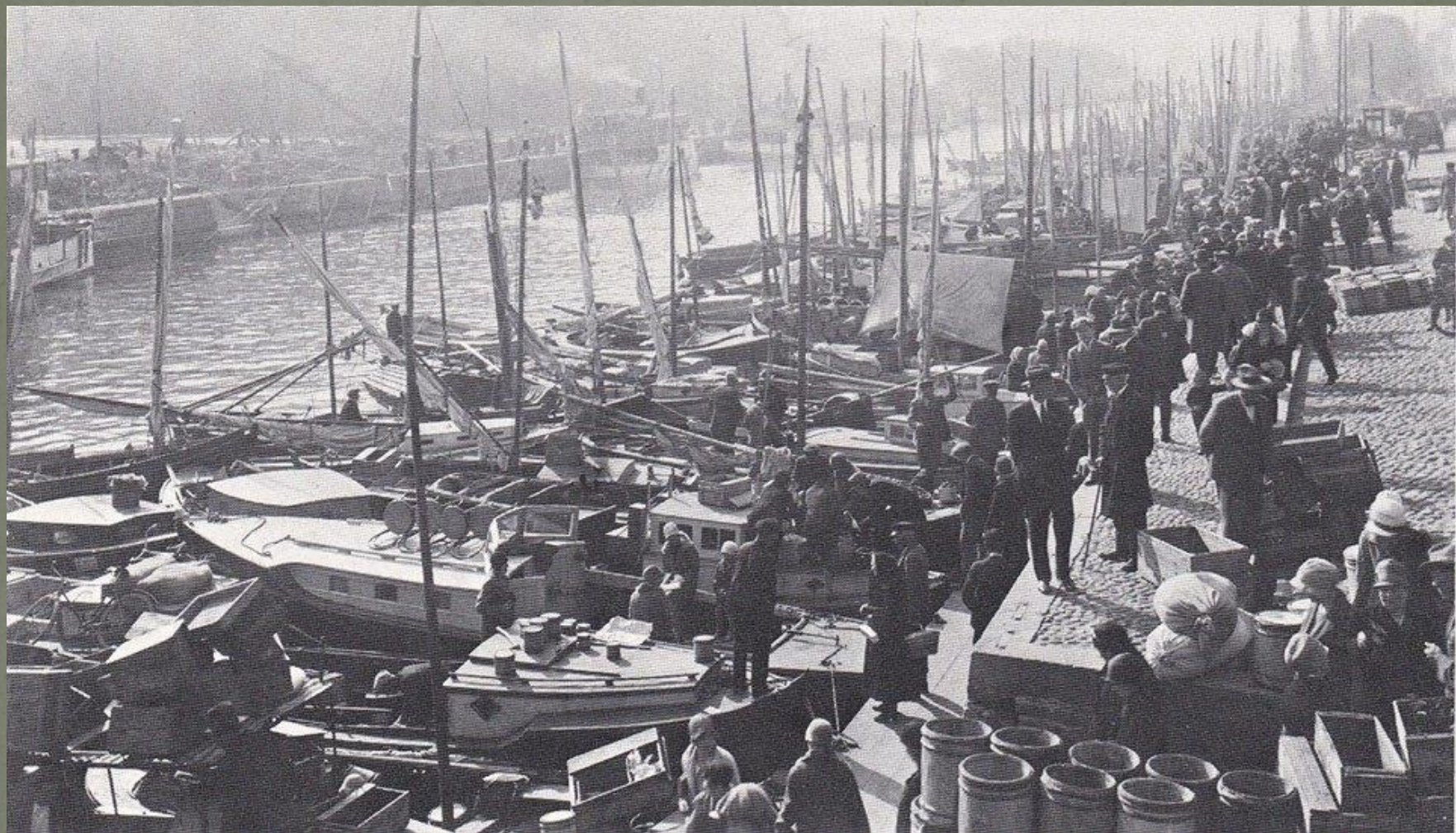
Olli Valo Facebook-ryhmässä "Postikorttien Turku"