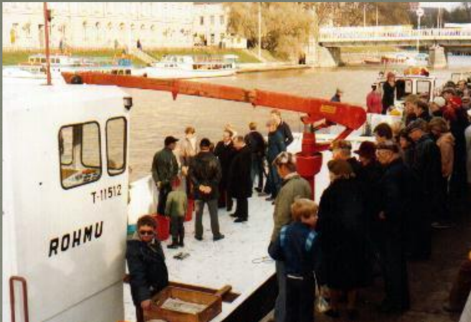
Kuva ensimmäisiltä silakkamarkkinoilta 1979.