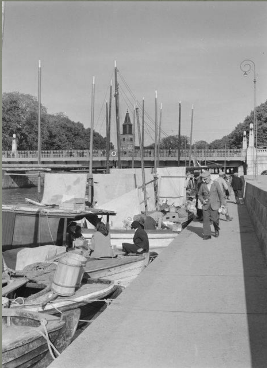
Silakkamarkkinat 1936. Pietikäinen 1936 CC BY 4.0 Museovirasto