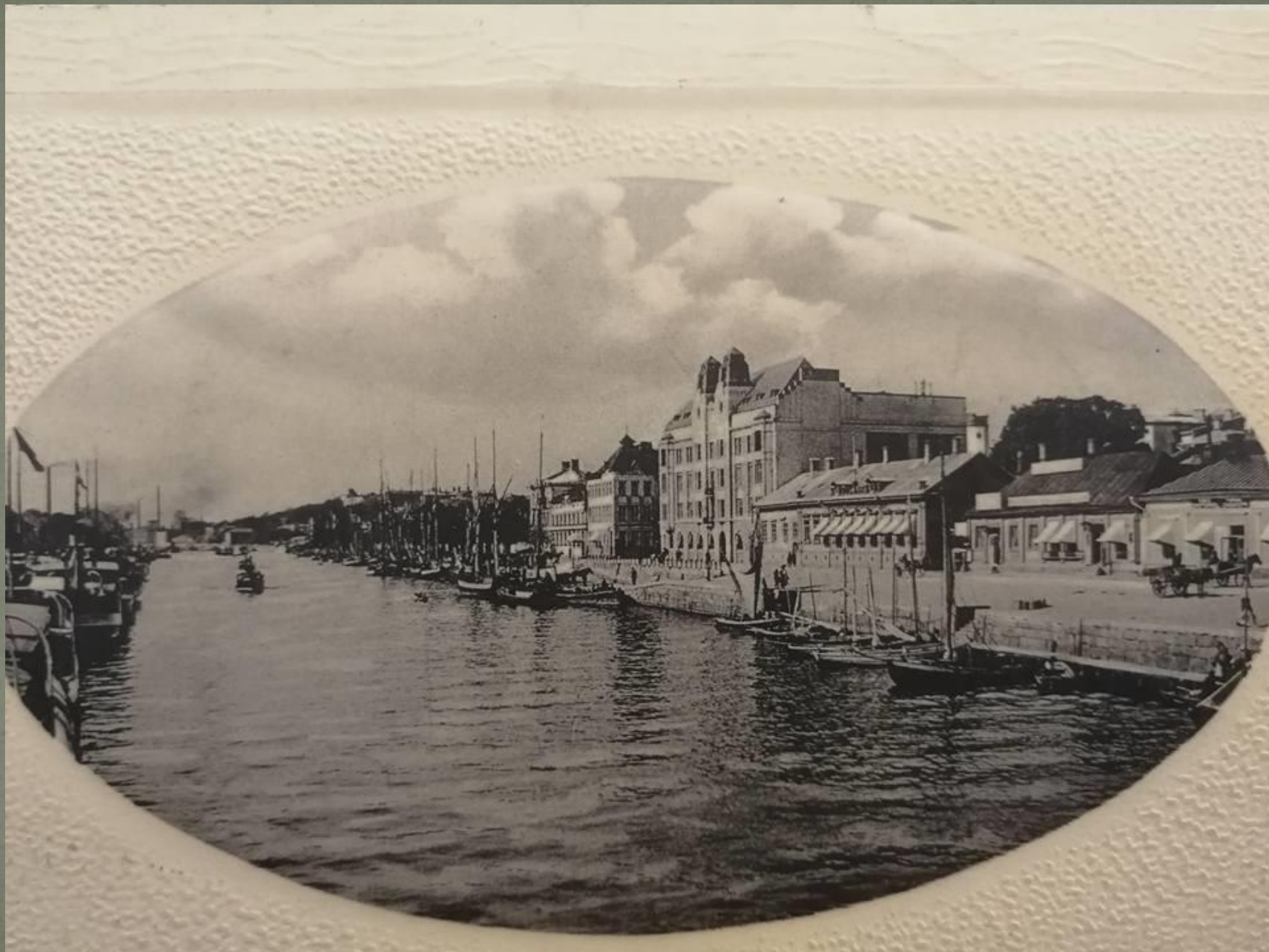
Libbe Sumelius Facebook-ryhmässä "Tämmöttis Turus enne ja ny