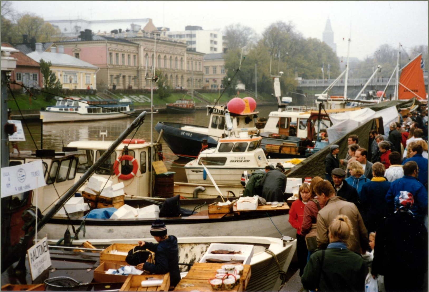
80-luvulla silakkamarkkinat olivat tois puolel jokke - kuva vuodelta 1982.