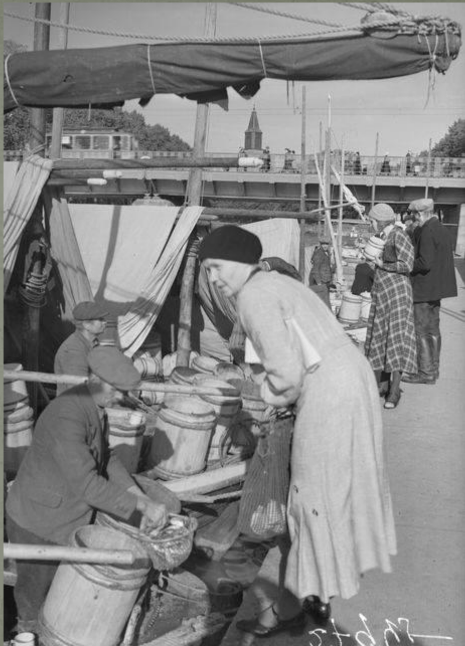
Kuva: Silakkamarkkinat Aurajoen rannassa Turussa