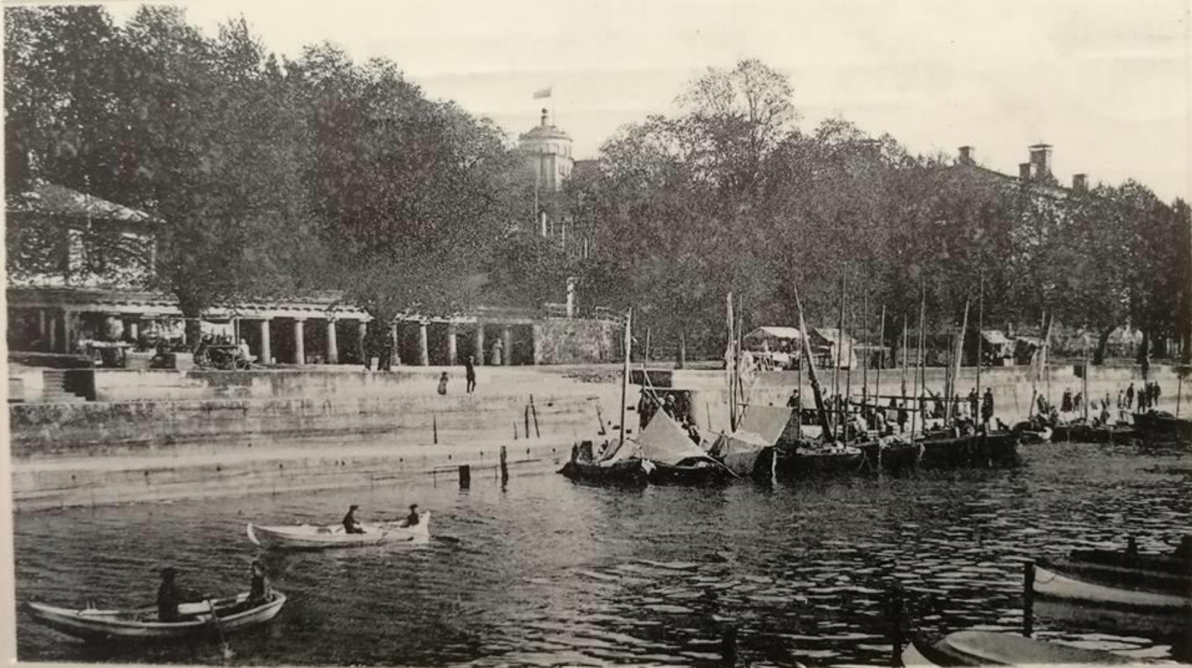
Libbe Sumelius Facebook-ryhmässä "Tämmöttis Turus enne ja ny